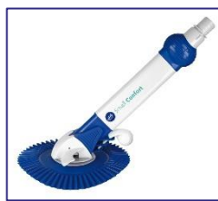
Nettoyeurs automatiques Autmatische zwembadreiniger