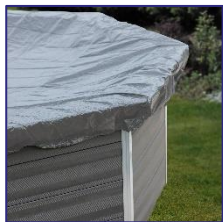
CIKPCOR60 Couverture d'hiver Winterafdekking