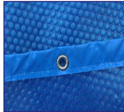
CVKPCOR60 Couverture isotherme Isothermische afdekking