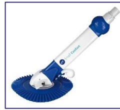
Nettoyeurs automatiques Autmatische zwembadreiniger