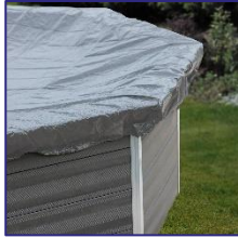
CIKPCOR60 Couverture d'hiver Winterafdekking