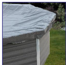
CIKPCOR46 Couverture d'hiver Winterafdekking