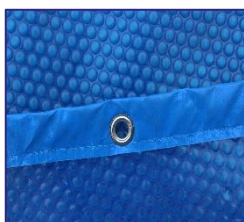
CVKPCOR46 Couverture isotherme Isothermische afdekking