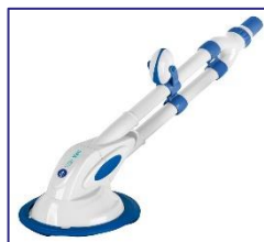
Nettoyeurs automatiques Automatische zwembadreiniger